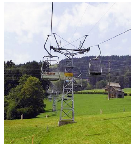
Bergbahn Wolzenalp, Krummenau