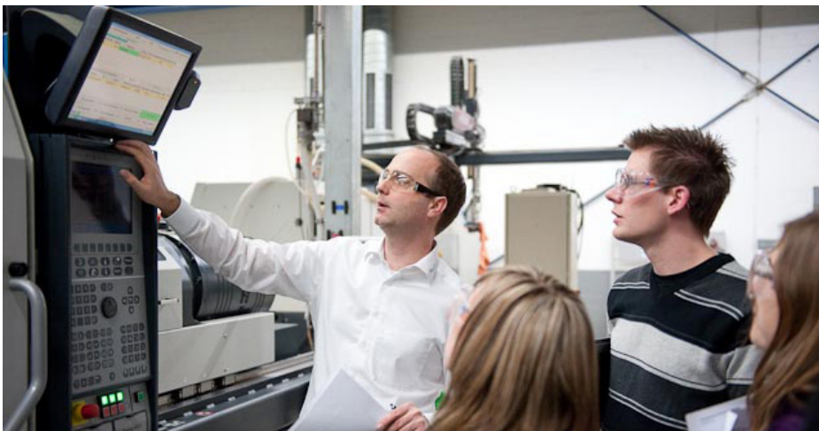
Impulstag bei Tyco Electronics AG, Steinach

Alternative Nutzungsmöglichkeiten für ein kantonales Landwirtschaftsgut abklären und einen Businessplan erstellen.